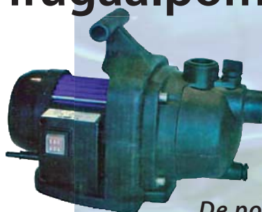
De pomp die overal inzetbaar is: Nautic 80 kunststof